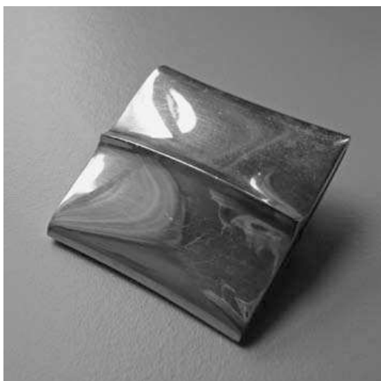
Françoise van den Bosch, Kussenobject, 1972, aluminium buis

en al, voor de vrolijke noot zorgen in een soms duf eruit ziende penningcollectie. Er bestaat geen optische verwantschap meer tussen voorwerpen die penningen heten en voorwerpen die zo dienen te worden genoemd. Ze onder één noemer samenbrengen lijkt wel een grap. De maker moet tegenwoordig expliciet bij het object vermelden dat het als penning bedoeld is. Wij vragen ons af of dit een zinvolle ontwikkeling is.