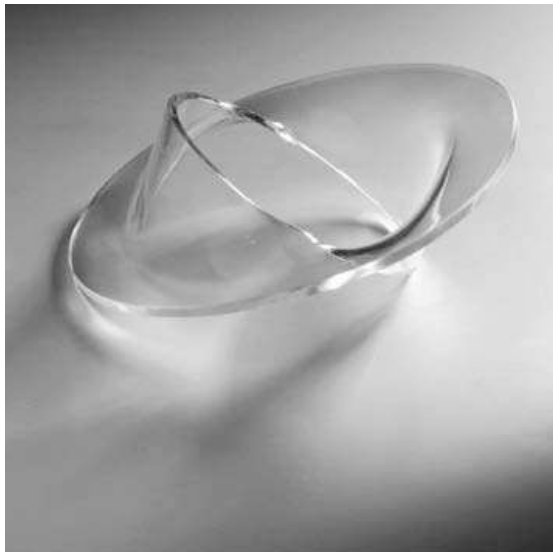
Gijs Bakker, Cirkel armband, 1967, perspex, 116mm

mate bij exposities tussen penningen, soms met een bijpassend foedraal. Alle penningkaders zijn vervallen, behalve de beperkingen in het formaat. Een object kan daardoor, met verpakking