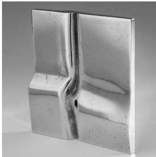
Frans de Wit, Penning, 1975, messing ( \frac{1}{4} ware grootte)