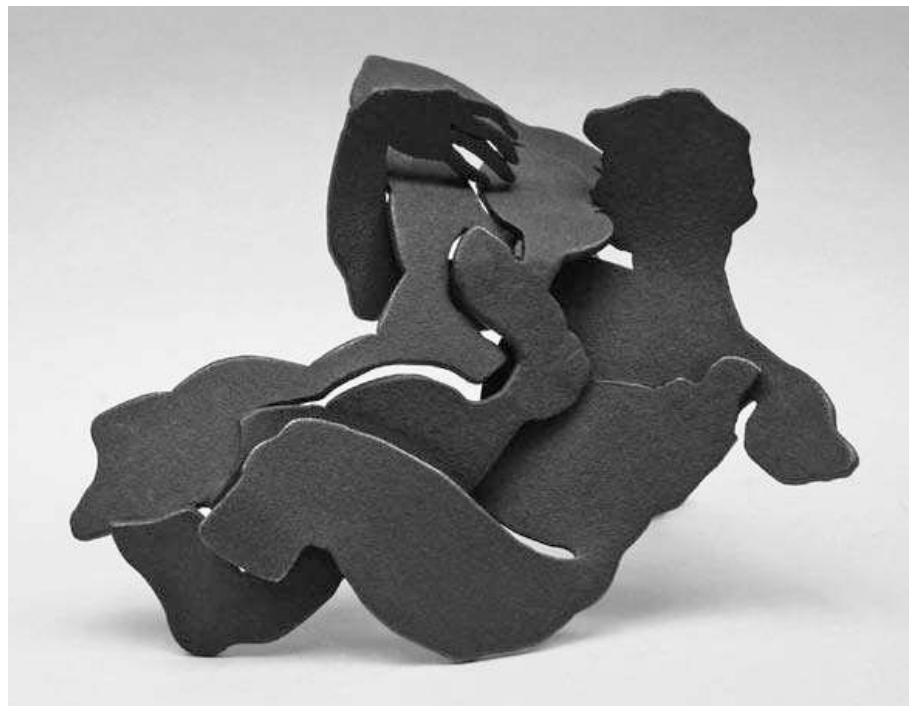
Linda Verkaaik, De Kus, 2004, verkoperd staal ( \frac{1}{3} ware grootte)

Bij penningen werden de meeste modellen gevormd door ze te boetseren of modelleren in klei of was, om daarna door gietmethoden ze te bestendigen, bijvoorbeeld in brons. Harde keramische modellen waren geschikt voor de zandvorm bronsgietmethode. Daarnaast werden er -grotere- modellen gemaakt voor reductie ten behoeve van slagpenningen, een techniek geschikt voor grote oplagen. Het contrast in werkwijze tussen design-objecten en penningen bleef grotendeels bestaan, behalve bij in brons gegoten objecten die tegen de penningkunst aanleunden. Naarmate beeldhouwers die niet in design onderlegd waren, min of meer in de designrichting penningen gingen maken, ofwel in staat waren 'objecten' te maken, al dan niet voor (re)productie, veranderde de aard van de visie op de penningkunst en werd er een overlap verondersteld tussen penningen en dergelijke objecten. Zelfs in penningkrin-