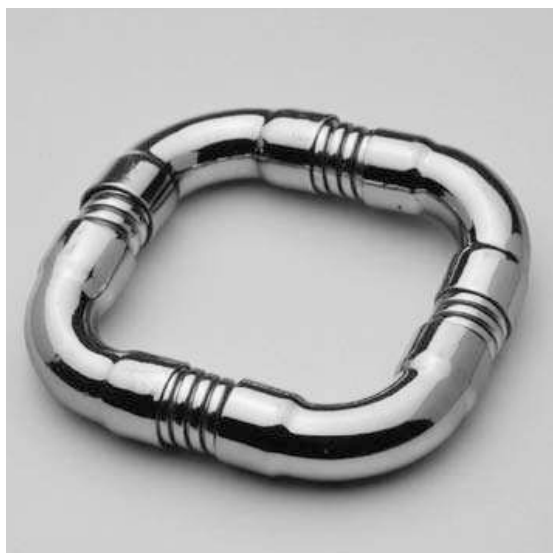
Marion Herbst, Armband, 1971, verchroomd koper en doucheslang