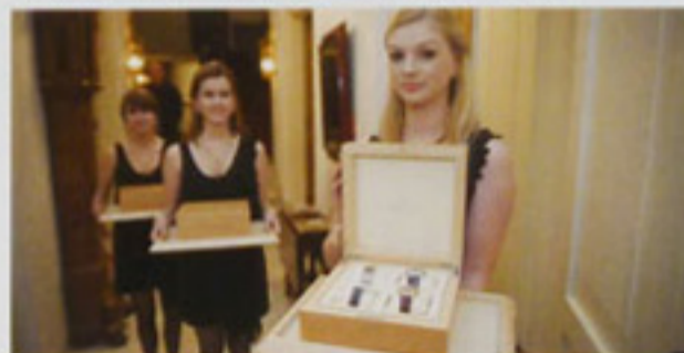
TUSSEN DE GANGEN DOOR WERDEN DE HORLOGES GESHOWD AAN DE 90 GASTEN.